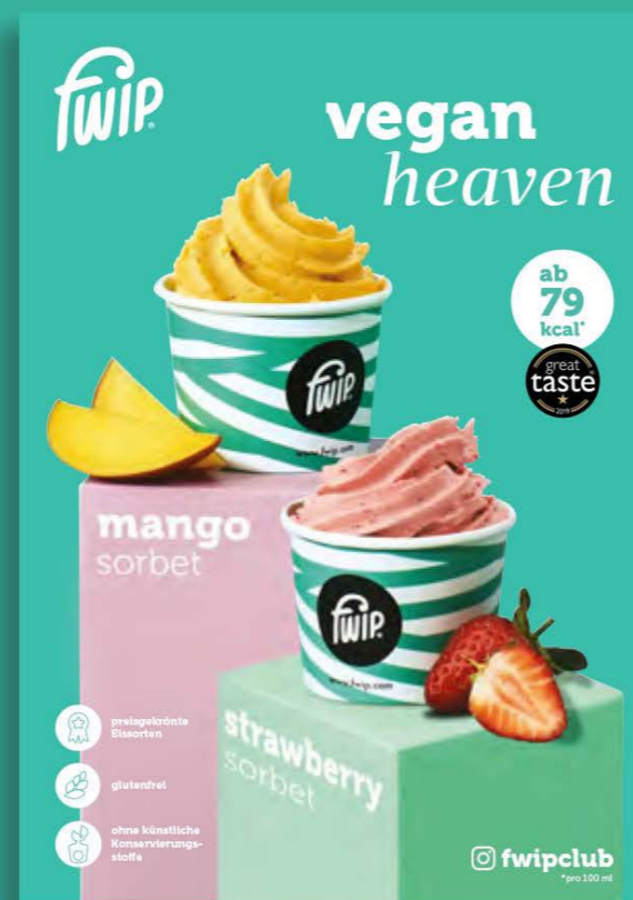
1 x Thekenaufsteller - Vegane Sorten