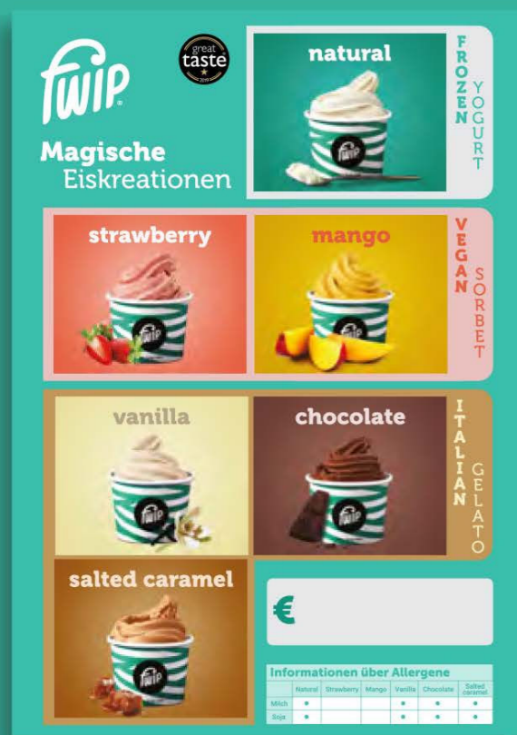
2 x Thekenaufsteller - Alle Sorten