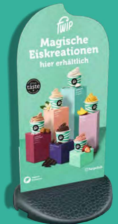
1 x Standschild