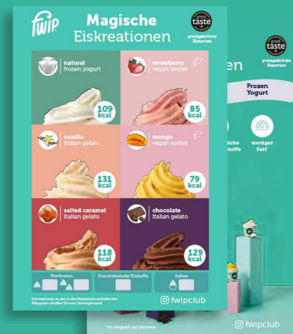
10 x Eiskarten/ Tischkarten